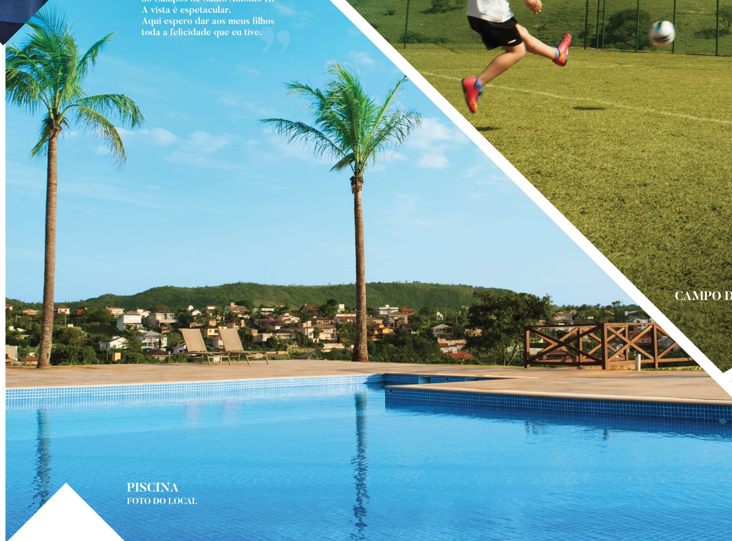
PISCINA FOTO DO LOCAL