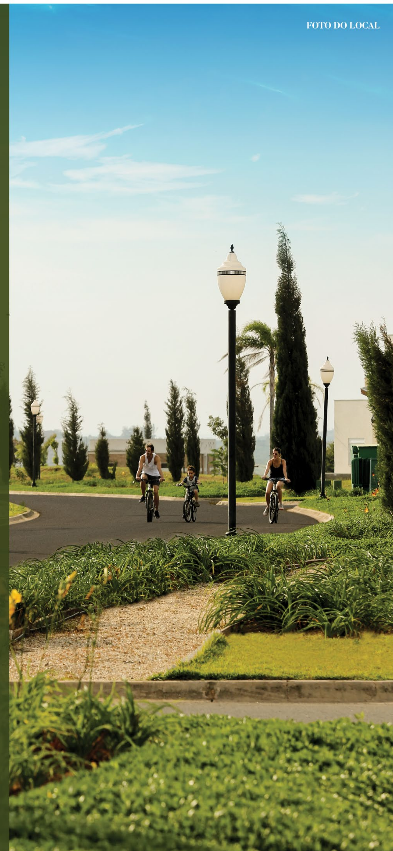
FOTO DO LOCAL