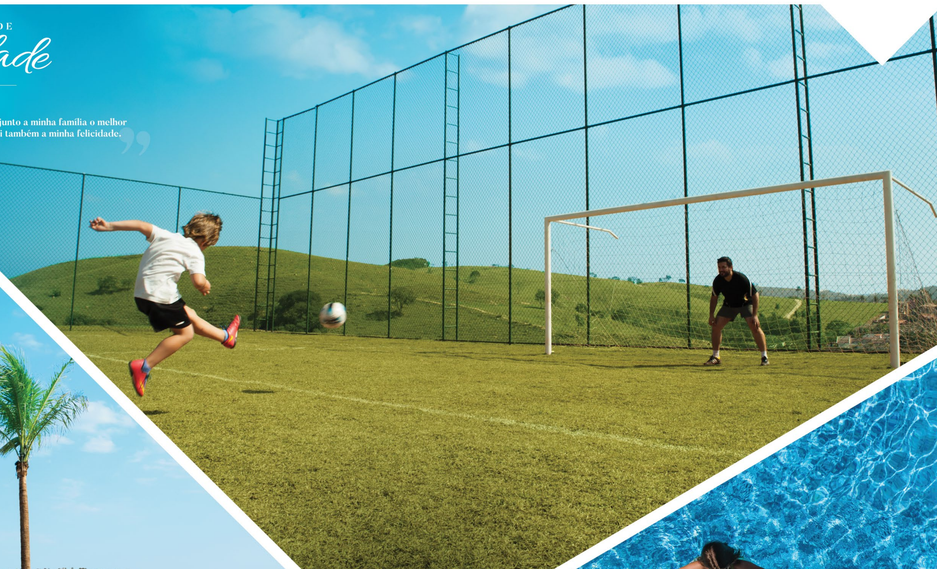
CAMPO DE FUTEBOL FOTO DO LOCAL

Agora sou proprietário de um lote no Campos de Santo Antonio II. A vista é espetacular. Aqui espero dar aos meus filhos toda a felicidade que eu tive.