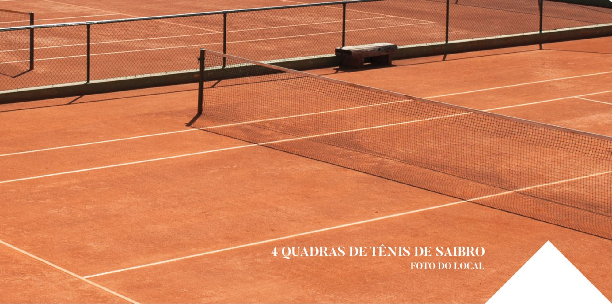
4 QUADRAS DE TÊNIS DE SAIBRO FOTO DO LOCAL